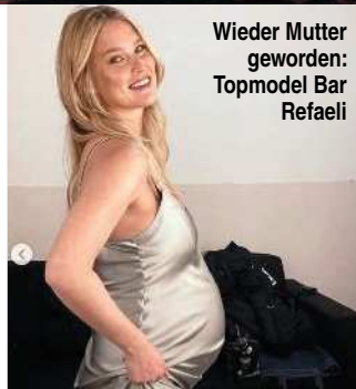
Wieder Mutter geworden: Topmodel Bar Refaeli

Auch Sängerin SIA , 44 („Chandelier“), ist jetzt Mama. Völlig überraschend verkündete sie in einem „GQ“-Interview, dass sie vor Kurzem einen Sohn adoptiert hat.